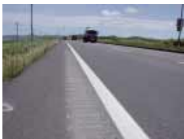
写真2-9. 路肩設置状況