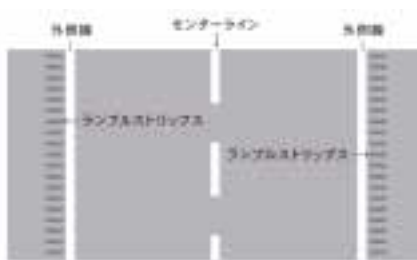
図2-6. ランブルストリップス設置位置