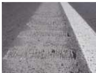
写真2-10. 路肩設置状況の拡大