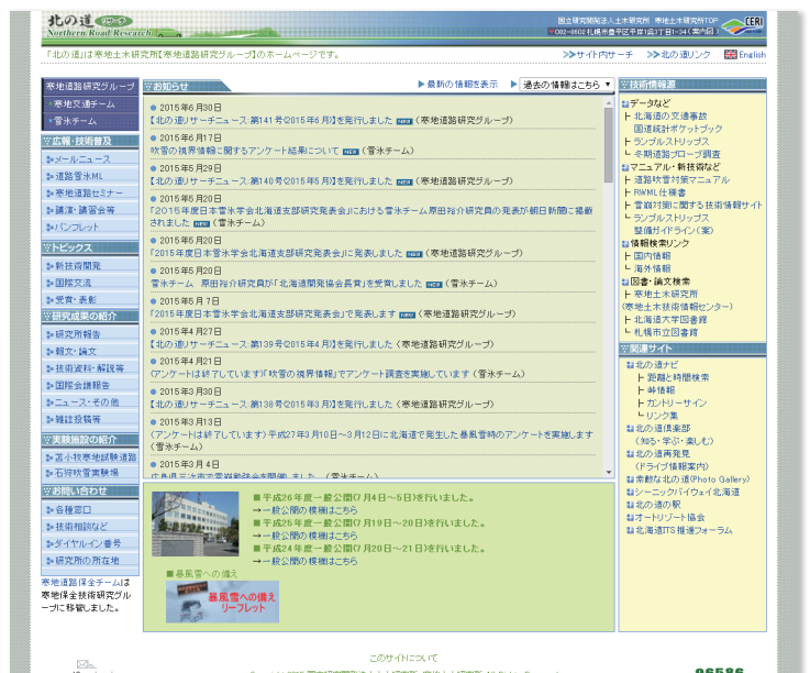
▲ホームページ「北の道リサーチ」 "Northern Road Research" website