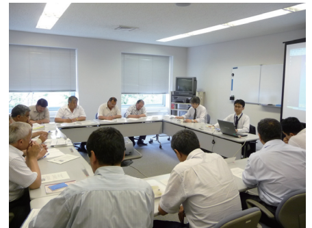
▲JICA 研修 JICA training session