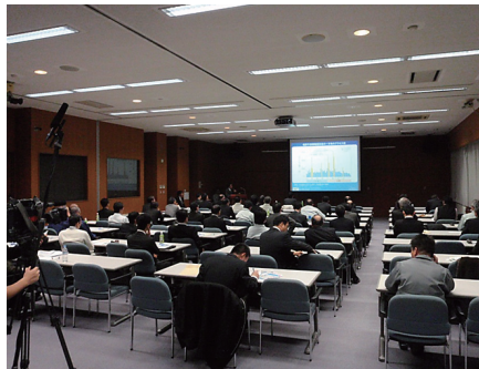
▲寒地道路連続セミナー The Cold-Region Road Engineering Seminar Series

The Snow and Ice Research Team holds seminars, such as the Cold-Region Road Engineering Seminar Series to disseminate technologies, and widely provides technological consultations to businesses and other institutions. The provision of technical education to trainees from overseas in a project commissioned to us by JICA is another important task.