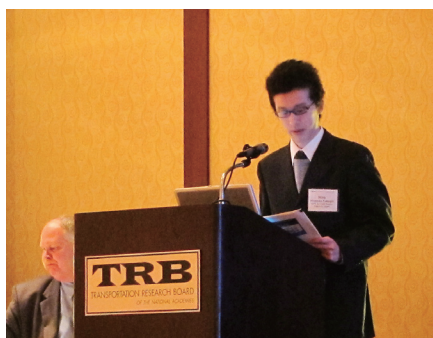
▲TRB 雪氷対策国際シンポジウム(アイオワ) TRB International Symposium on Snow Removal and Ice Control Technology (Iowa, USA)

The Group promotes international exchanges with engineers around the world by participating in international conferences held by the Transportation Research Board (TRB) of the USA and the World Road Association (PIARC) as a presenter and a member of the organizing committees.