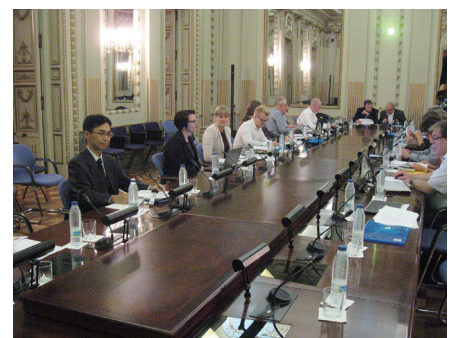
▲PIARC 冬期サービス委員会(マドリッド) PIARC's Technical Committee on Winter Services (Madrid, Spain)