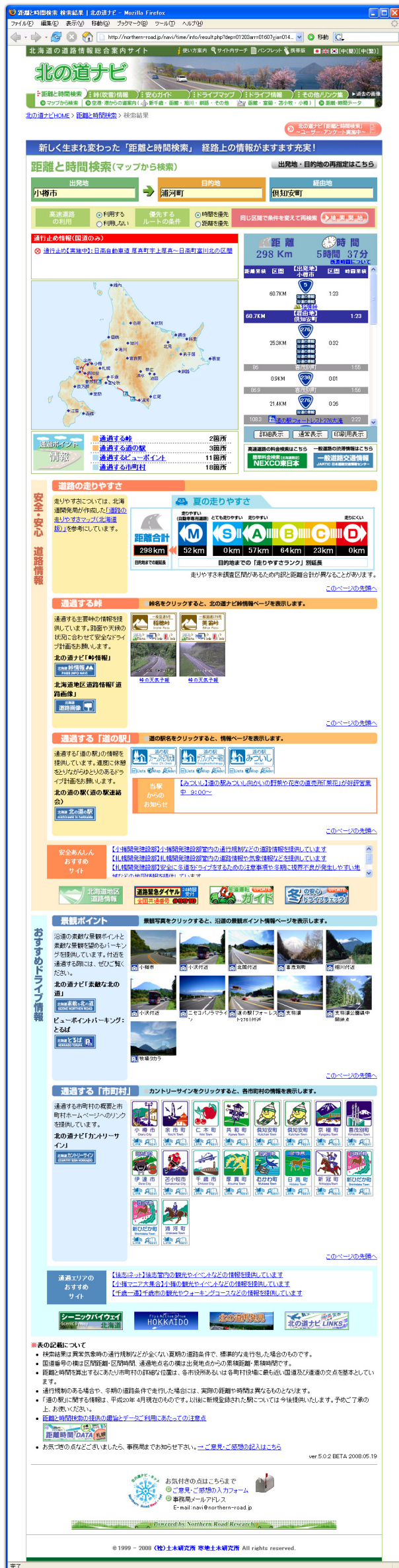
▲図-2 「距離と時間検索」の検索結果 Figure 2. Result of time and distance search