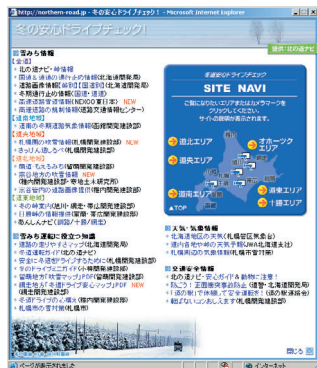
▲北の道ナビ「冬の安心ドライブチェック」 Northern Road Navi: Check road conditions for safe winter driving