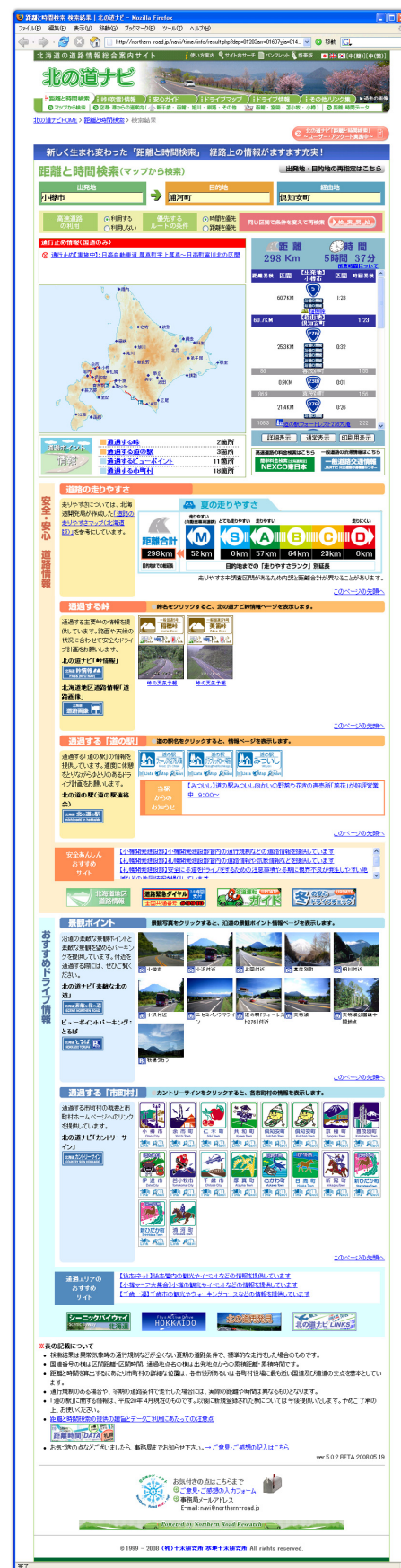
▲図-2 「距離と時間検索」の検索結果