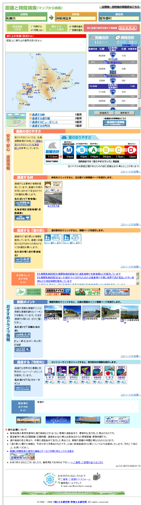
▲図-2 「距離と時間検索」の検索結果