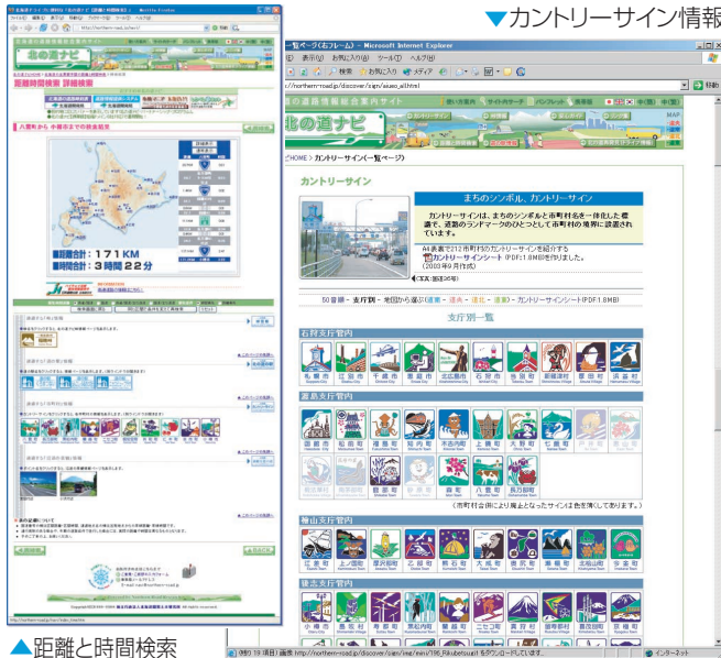
▼カントリーサイン情報

今後は、道路利用時におけるバリアフリー情報の充実や、各種道路に関する観光イベント情報等の充実を進め、北海道における道路情報総合案内サイトとしての役割を果たしていきます。