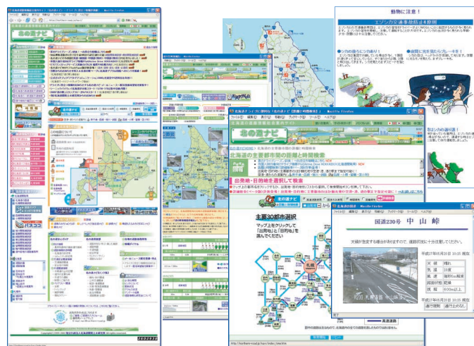
▲「北の道ナビ」で提供する情報（一部）

「北の道ナビ」では、多様化する道路情報に関するニーズに応えるため、道路に関わる「情報」を幅広くそろえています。その内容は、道路気象・各種通行止め情報・主要都市間の距離と時間など、道路を利用する上で役立つものから、北海道開発局提供の峠のリアルタイム画像情報や、冬道安全運転ガイドなどの各種安全走行をサポートする情報まで多彩です。