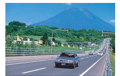
▲すばらしい景観を多く持つ北海道の国道