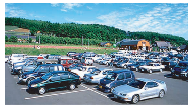
▲車の利用が多い北海道の観光