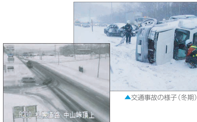
▲交通事故の様子（冬期）

北海道は日本の北部に位置しており、広大な大地に200万人都市圏である札幌をはじめとして都市が点在し、道路が人々の生活を支える役割が非常に大きい地域です。また北海道は、積雪寒冷地に位置し、冬期間の気象は非常に厳しいものとなっています。特に峠部では10月下旬から5月上旬まで積雪に見舞われ、路面が積雪で覆われるため、道路に関する様々な情報は、北海道で安全・快適に暮らすために欠くことのできない重要な情報です。