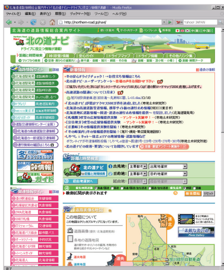
図1 「北の道ナビ」トップページ http://n-rd.jp/