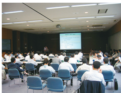
セミナーの 開催状況