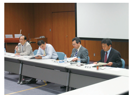
パネルディスカッションの 開催状況