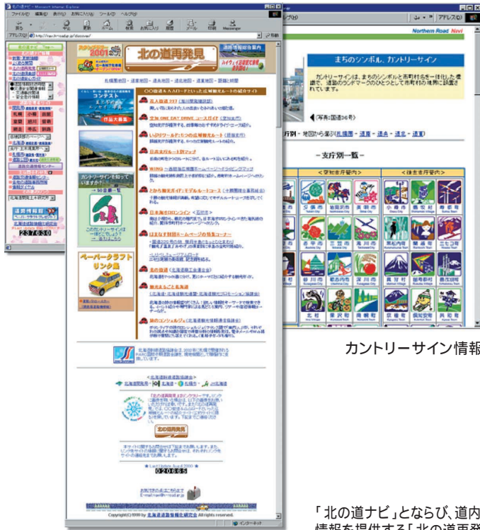
カントリーサイン情報

今後は、道路利用時におけるパリアフリー情報の充実や、各種道路に関する観光イベント情報等の充実を進め、北海道における道路情報総合案内サイトとしての役割を果たしていきます。