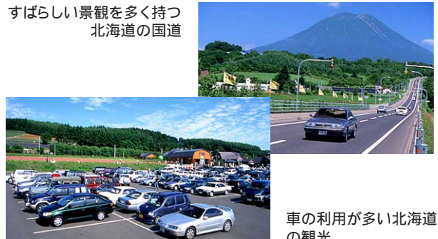
車の利用が多い北海道の観光