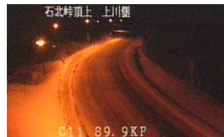
石北峠頂上 上川圏 北海道開発局提供の峠カメラからの画像

北海道は日本の北部に位置しており、広大な大地に200万人都市圏である札幌をはじめとして都市が点在し、道路が人々の生活を支える役割が非常に大きい地域です。また北海道は、積雪寒冷地に位置し、冬期間の気象は非常に厳しいものとなっています。特に峠部では10月下旬から5月上旬まで積雪に見舞われ、路面が積雪で覆われるため、道路に関する様々な情報は、北海道で安全・快適に暮らすために欠くことのできない重要な情報です。