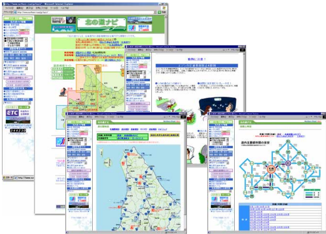
「北の道ナビ」で提供する情報(一部)

「北の道ナビ」では、多様化する道路情報に関するニーズに応えるため、道路に関わる「情報」を幅広くそろえています。その内容は、道路気象・各種通行止め情報・主要都市間の距離と時間など、道路を利用する上で役立つものから、北海道開発局提供の峠のリアルタイム画像情報や、冬道安全運転ガイドなどの各種安全走行をサポートする情報まで多彩です。