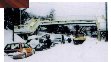
大雪による通行止め