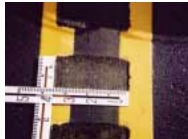
写真 2-6. 追越禁止黄色2条線区間設置状況の拡大