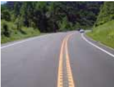
写真 2-5. 追越禁止黄色2条線区間設置状況