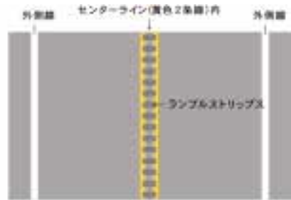
図 2-2. ランブルストリップス設置位置