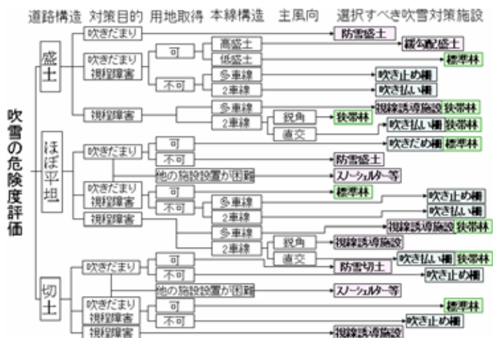
図2 吹雪対策施設の選択フロー

ただし適用にあたっては、たとえば吹き払い柵では最深積雪が深い場合など、このフローに沿えない場合もあり、詳しい留意点、併用して利用できる施設などは新マニュアルの各章を参照ください。