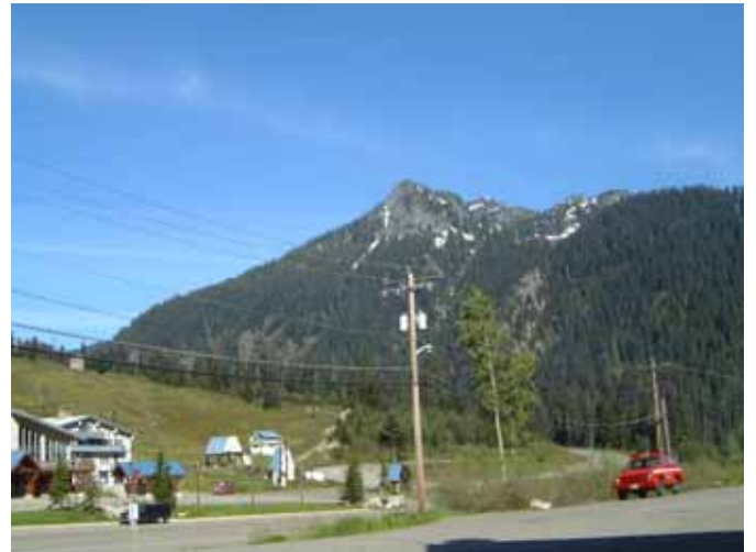
図 9 雪崩監視をしている山々

峠区間の雪崩監視では、迫撃砲を使った人工雪崩により処理することもあるとのことでした。