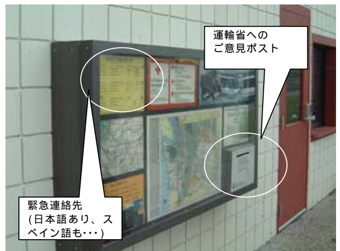
図 13 トイレに掲げられた掲示板

中国でも、トウモロコシ・ベースの凍結防止剤を用い始めていると聞いています。日本では、まだ単価が高いため、農業副産物の利用はありませんが、今後の検討課題になってくると思います。