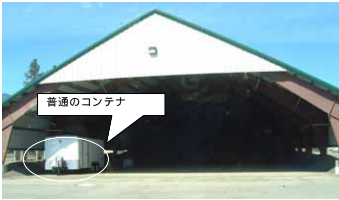
図 10 岩塩保管庫 (大きさがわかりますか・・・)