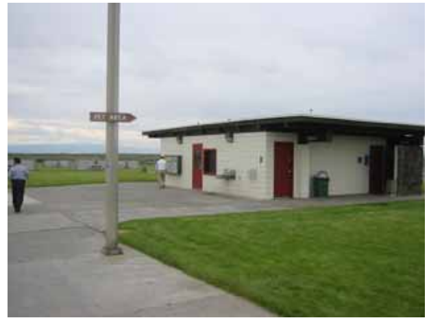
図 12 パーキングエリアの施設 (トイレのみです)