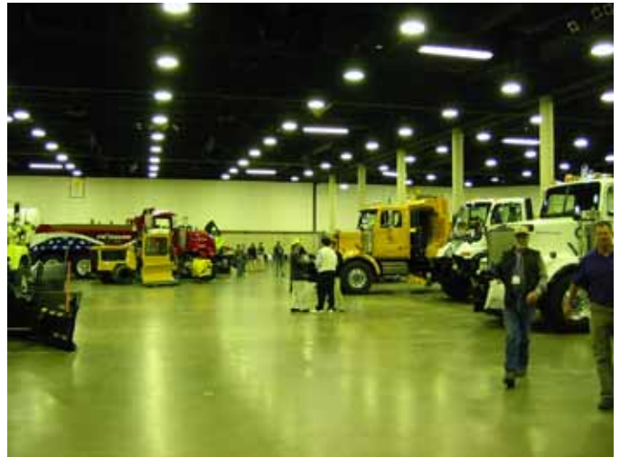
図 4 道路維持車両の展示(見本市)

吹雪関連では、ラバー製の防雪柵(吹きだめ)が展示されていました。非常に軽いもので、強い吹雪には吹き飛ばされないかとの疑念も感じましたが、撤去・設置とも軽量のため容易と想像され、日本でも適用できるのではないかと思います。