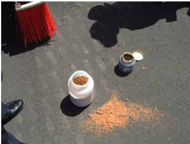
図 11 凍結防止剤 (左が岩塩、右がトウモロコシの糖蜜)