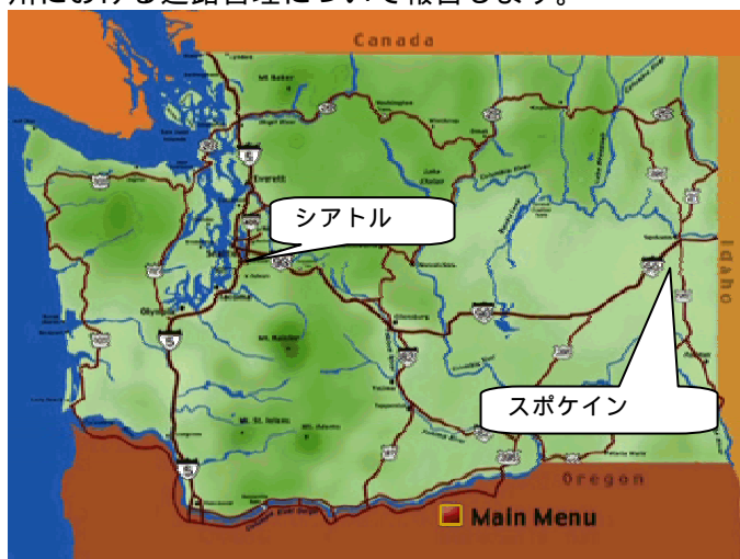
図1 スポケインの位置(ワシントン州)

本稿では、上記シンポジウムの内容とワシントン州における道路管理について報告します。