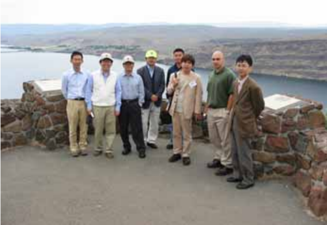
図 15 シーニックビューポイントで