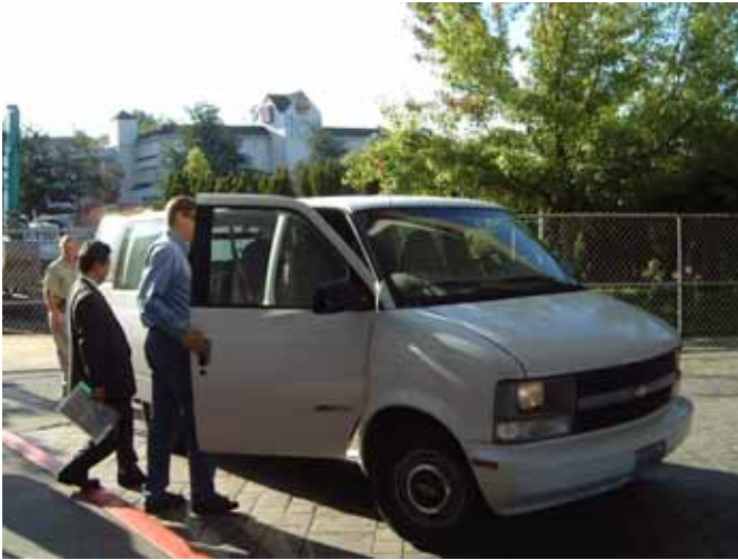
図 6 乗車したワシントン州運輸省のバン

シアトル市内部では通勤時間帯ということもあって、多少の渋滞が見られましたが、郊外に出るとやがて解消されていきました。