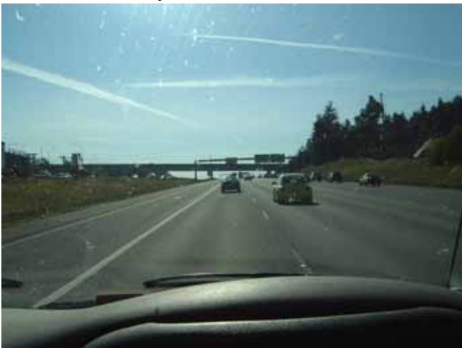
図 7 高速道路(シアトル近郊)

また、居眠り運転による路外逸脱防止対策として、走行した高速道路では、全区間において路側 (中央帯及び路肩) にランブルストリップスが敷設されていました。特に印象的だったのは、経費削減のためか不連続なランブルストリップスが路肩側に設置されていたことでした。