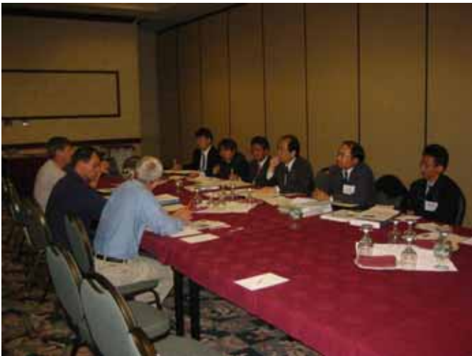
図 3 ワシントン州運輸省との意見交換

その他、交通安全対策の一環として米国で早くから適用されているランブルストリップスについて伺いました。特に、二車線道路での正面衝突事故対策としての適用例について質問したところ、そのようなランブルストリップスの設置箇所は州内に2箇所あり、その他ガードケーブルの設置などを行っているとのことでした。