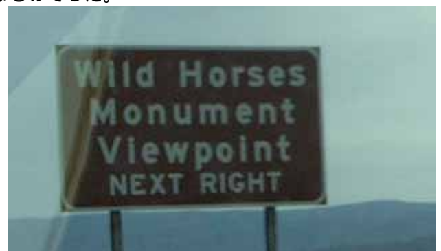
図 14 ビューポイントを表す標識

また、走行した路線の一部は、シーニック区間に指定されています。そこで道路には、景観のよい箇所に標識とともにパーキングが設けられていました。図 15 は、コロンビア川を望む非常に景色のよいところでした。対岸まで 1,500m もあり、スケールの大きなものでした。